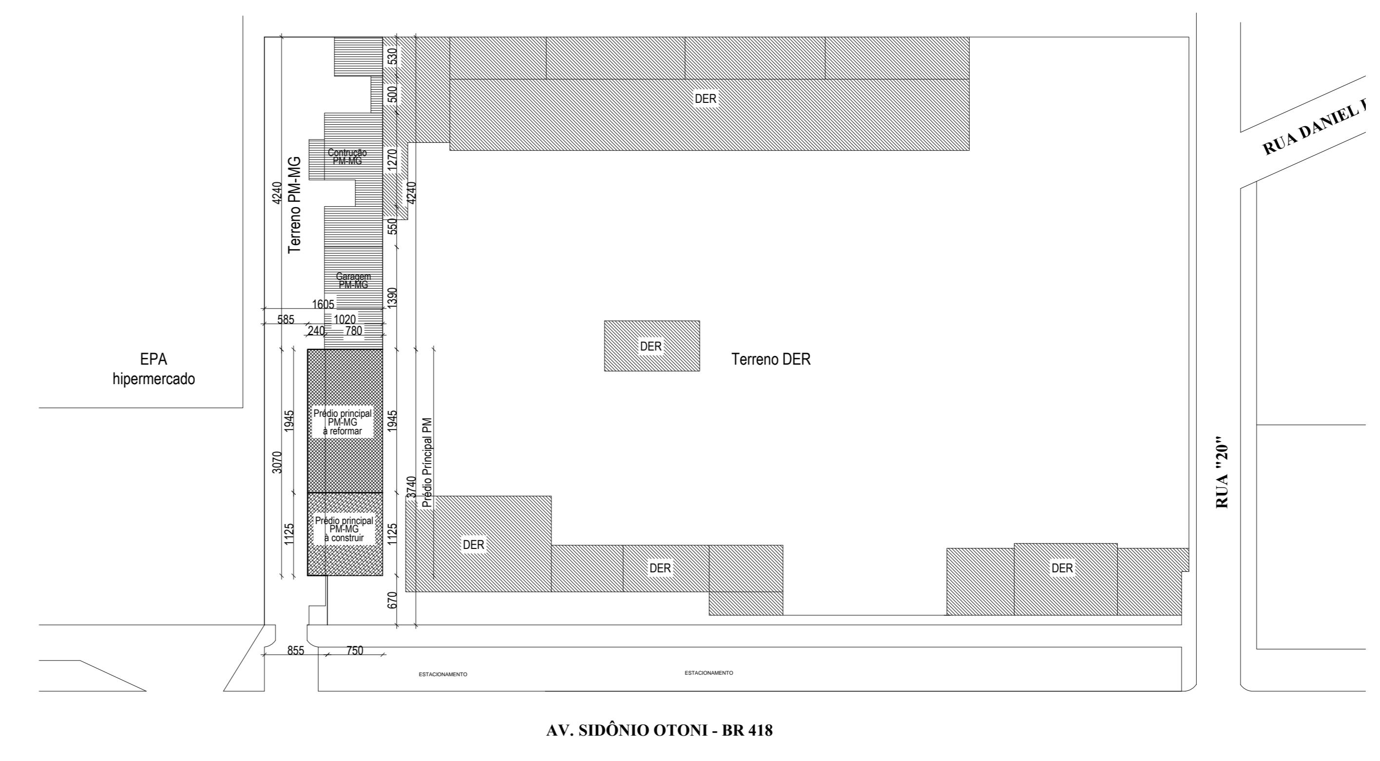
Diagrama Telhado Esc.: 1/75